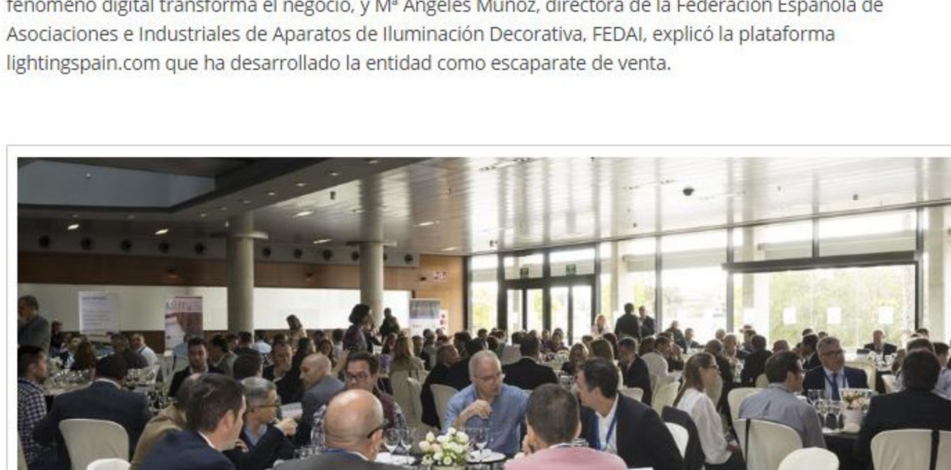
Más de 250 congresistas debatieron sobre el sector del hábitat, en un encuentro donde el almuerzo permitió cambiar impresiones de manera más distendida.